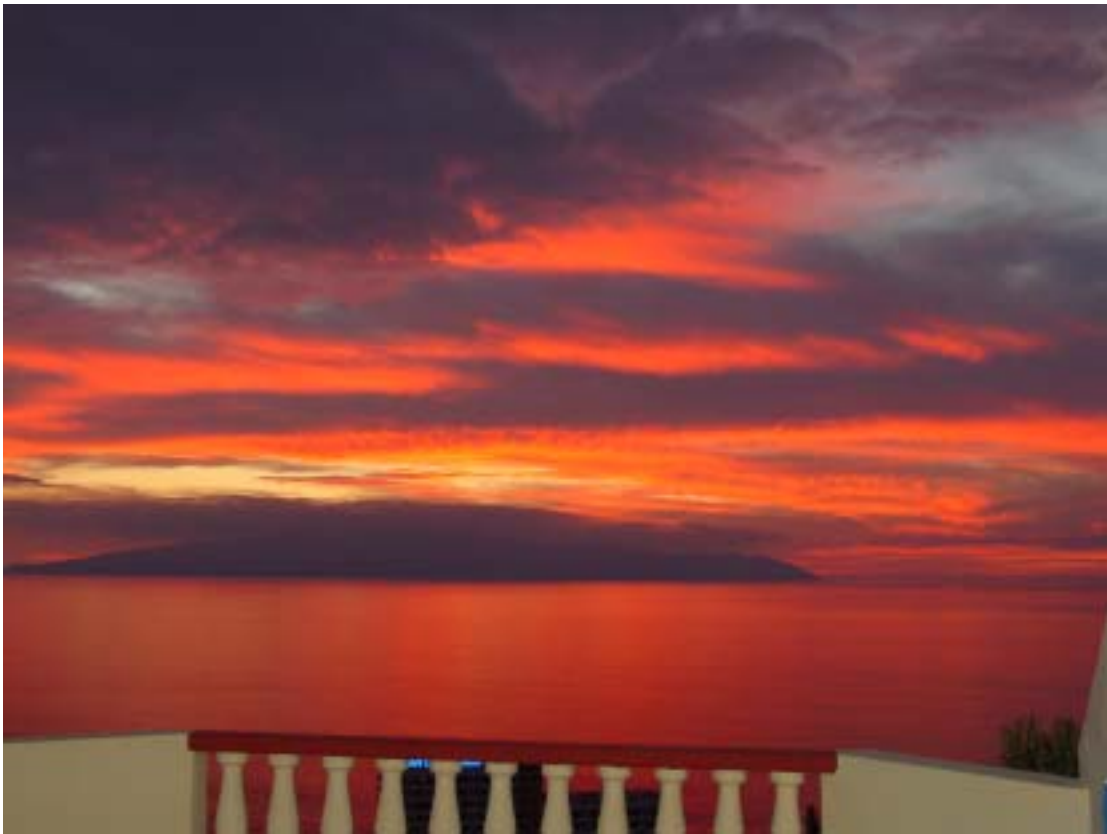
Solnedgang over La Gomera